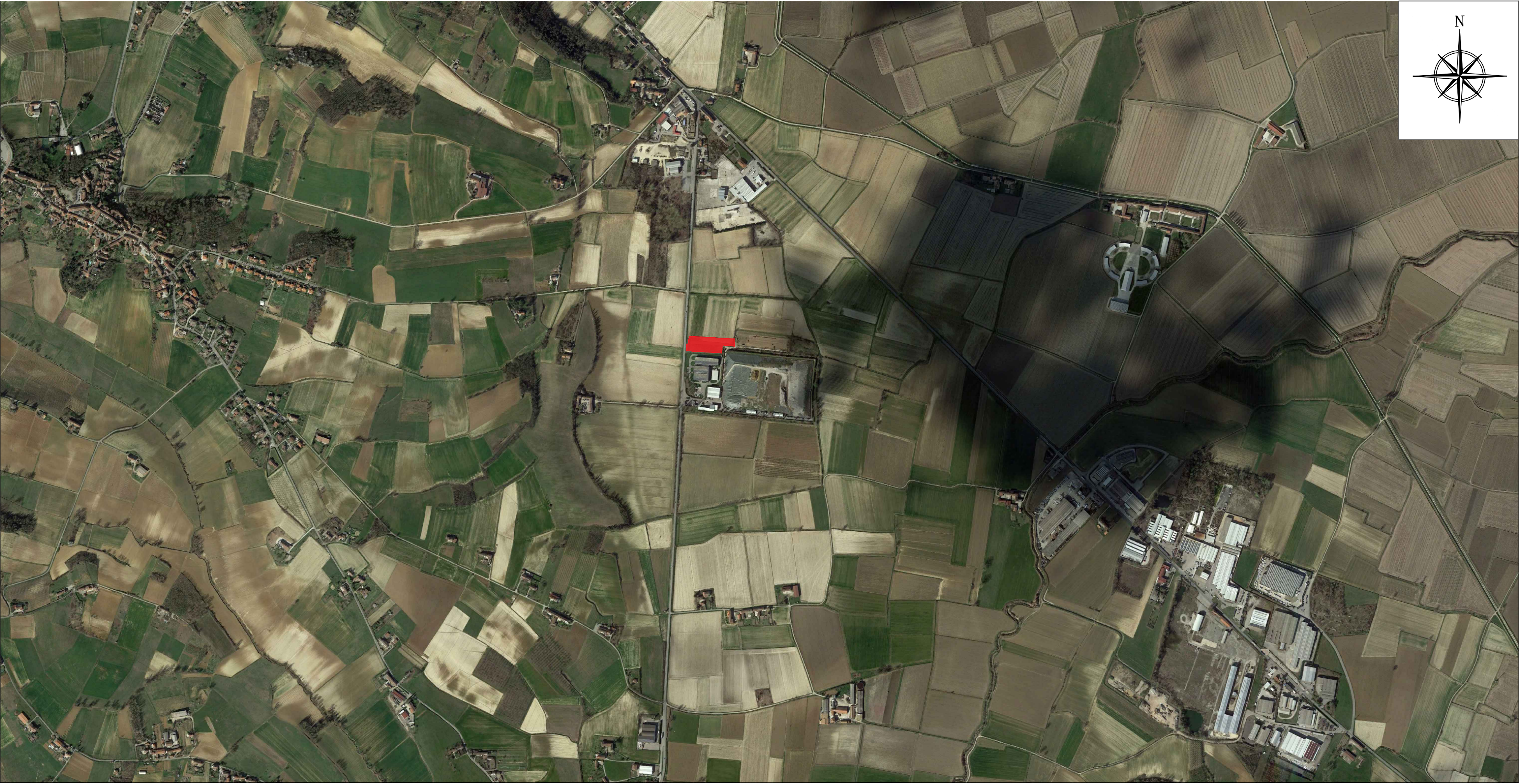
Immagine saettlitare area vasta - scala 1:10.000