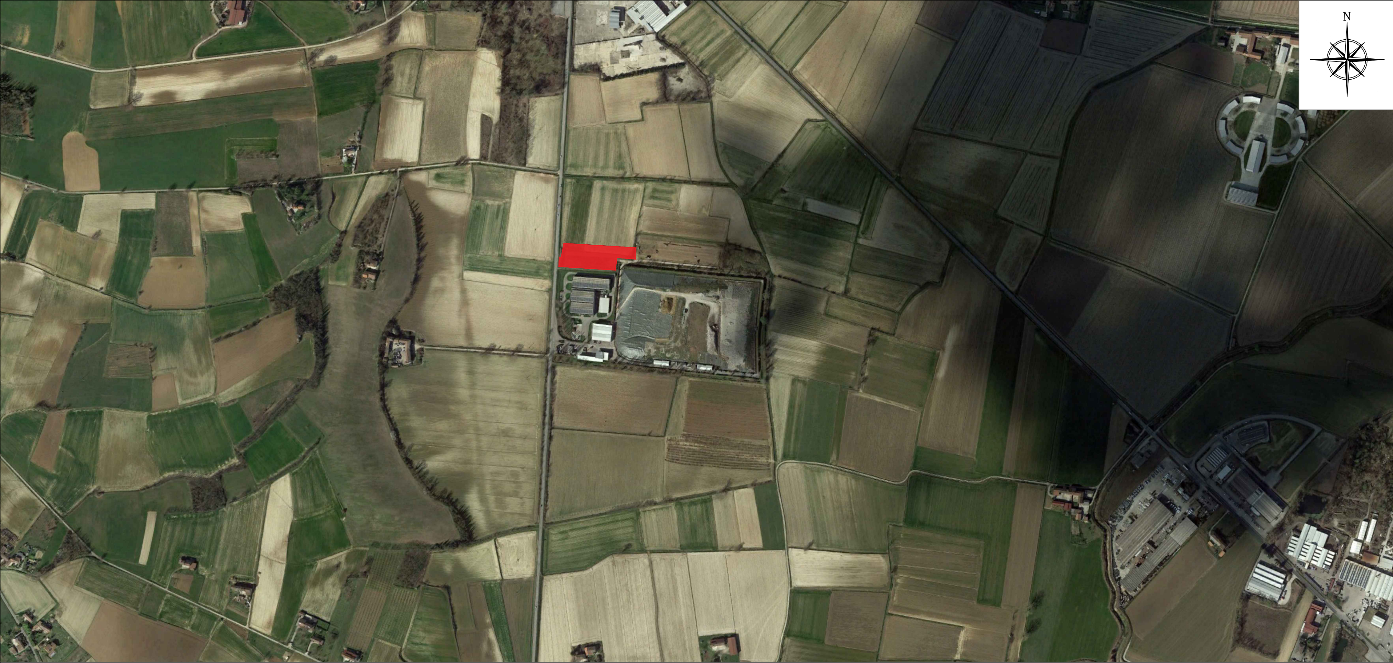
Immagine saettlitare area intervento - scala 1:5.000

PROGETTO PER LA REALIZZAZIONE DELL'IMPIANTO PER IL TRATTAMENTO ED IL RECUPERO DI RIFIUTI URBANI E ASSIMILABILI DA PRODOTTI ASSORBENTI PER LA PERSONA PAP - CASALE MONFERRATO (AL)